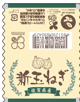
■エコ佐賀県産新玉ねぎ 商品コード：499071