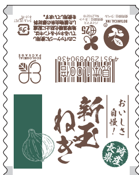
■エコ長崎県産新玉ねぎ 商品コード：499073