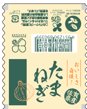
■エコ佐賀県産玉ねぎ 商品コード：499061