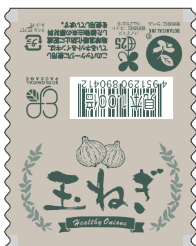
■エコ玉ねぎ 商品コード：499060