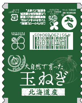
■エコ北海道産玉ねぎ 商品コード：499062