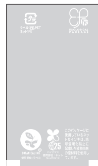
■胴貼用ラベルエコ透明無地 商品コード：498050