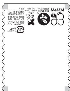
■ヘッダーエコ白無地 商品コード：499050