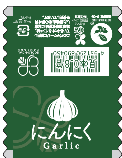
■エコにんにく 商品コード：499080