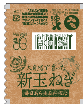
■エコ新玉ねぎ 商品コード：499070