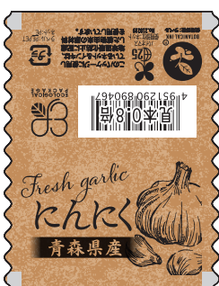
■エコ青森県産にんにく 商品コード：449081